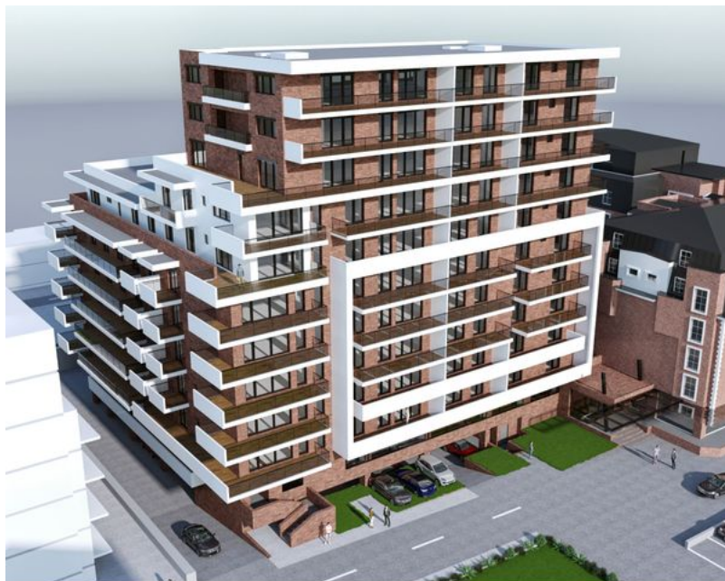
PERSPECTIVA AERIANA, FATADE NORD-VEST